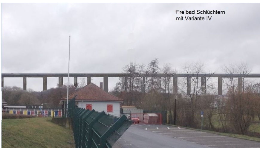
Freibad Schlüchtern mit Variante IV

Regelmäßiger Stammtisch! Termine auf der Webseite.